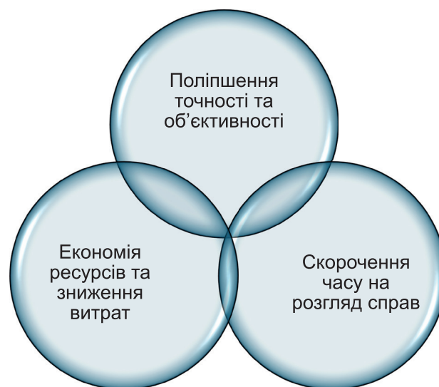
Рис. 5. Переваги економічних інновацій у судовій експертизі

Розвиток економічних інновацій у судовій експертизі викликає необхідність адаптації правового та законодавчого регулювання. Важливо розробити відповідні норми та стандарти для використання технологій штучного інтелекту, цифрових доказів та блокчейн у судових процесах (рис. 5).