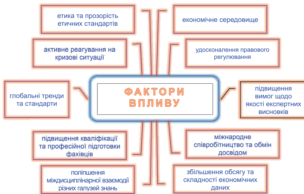
Рис. 1. Основні фактори, що впливають на розвиток судової експертизи

У світі обсяг і складність економічних даних зростають експоненційно. Для їх аналізу та інтерпретації потрібні нові підходи та інструменти, що ґрунтуються на економічних інноваціях [7]. Ці інструменти допомагають експертам обробляти великі масиви даних з високим ступенем точності та деталізації, що суттєво покращує якість експертних висновків.