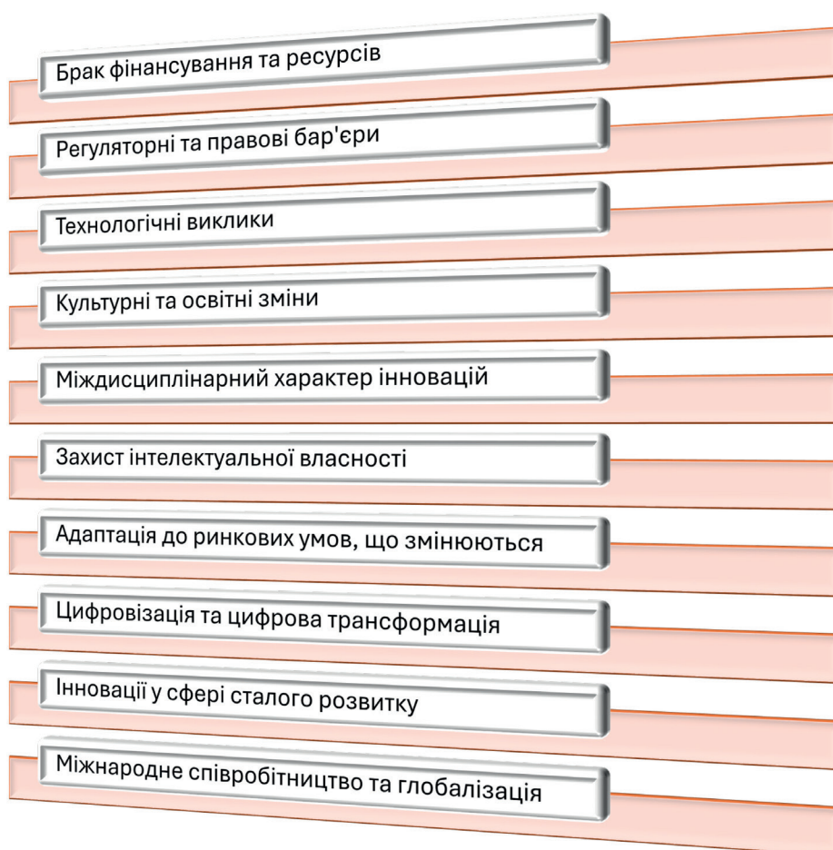
Рис. 3. Виклики та проблеми впровадження економічних інновацій

Економічні інновації відіграють ключову роль у сучасній економіці, сприяючи зростанню, сталому розвитку та покращенню якості життя. Інновації потребують комплексного підходу та співробітництва між державою, бізнесом та суспільством для максимального їхнього ефекту та користі. Однак для успішного впровадження їх необхідно вирішувати виклики та проблеми, пов'язані з фінансуванням, регуляторним забезпеченням, технологічними та культурними аспектами (рис. 3).