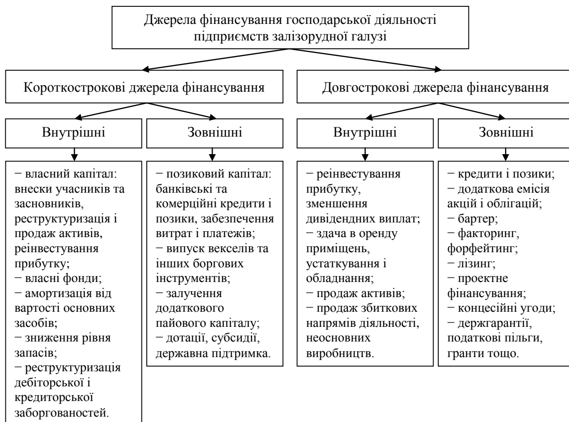
Рис. 1. Можливі джерела фінансування господарської діяльності підприємств залізорудної галузі

Керівники підприємств мають обґрунтувати доцільність та оцінити вигідність поєднання якомога різних джерел фінансування. Досить часто інвестиційно-інноваційний проект модернізації виробничих процесів неможливо завершити через брак фінансових ресурсів, які варто спрямувати на погашення кредиторської заборгованості перед інвесторами. У результаті цього проект або відкладається (консервується), або продовжує фінансуватися з додаткових зовнішніх джерел, або ж переходить в іншу власність. Зазвичай останній варіант свідчить про банкрутство проекту, що є неабияким тривожним сигналом для господарської діяльності підприємств та галузі в цілому. Таким чином, помилка у виборі джерел фінансування хоча б одного проекту вже може стати причиною поступового банкрутства всієї господарської одиниці.