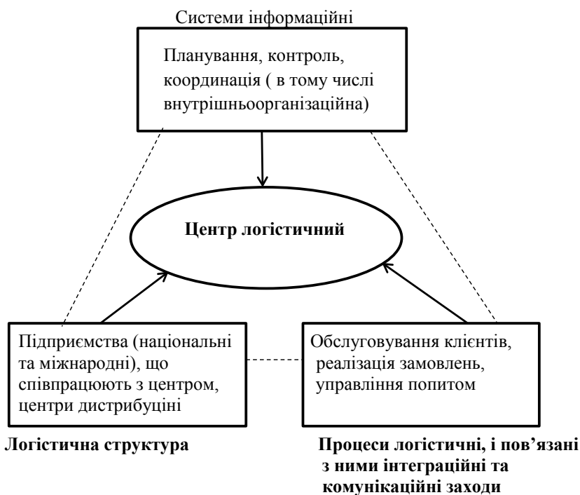
Рис. 2. Діаграма функціонування логістичного центру

Виробник повинен бути «близьким до замовника». Це не просто просторово знаходження на одній території, через те, що в сучасний період господарювання споживачі частіше використовують різні види онлайн-нових послуг. Вони хочуть стежити за своїми това-