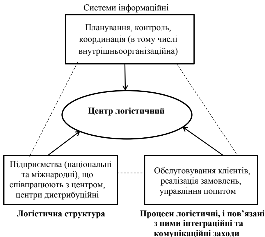
Рис. 2. Діаграма функціонування логістичного центру

Ці функції включають матеріальні, інформаційні та фінансові потоки. Без такої інтеграції було б неможливо запропонувати комплексне логістичне обслуговування.