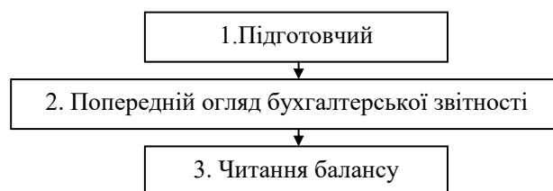
Рис. 1. Етапи експрес-аналізу [8]

Для того, щоб проаналізувати всі аспекти фінансового стану підприємства, потрібно