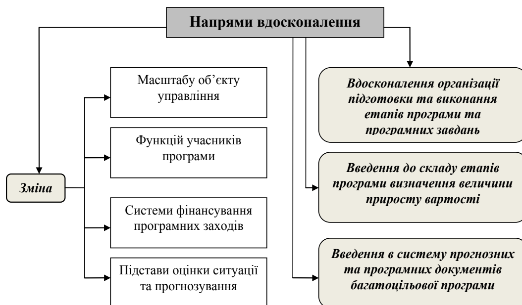
Рис. 2. Основні напрями вдосконалення економічного програмування для складання багатocільових програм розвитку малої гідроенергетики

функціонування однією з найбільш екологічно безпечних ресурсних функцій є використання рекреаційного потенціалу [5, с. 182], що представляється досить актуальним і своєчасним.