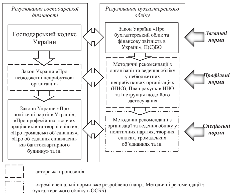
Рис. 2. Структура законодавчо-нормативного регулювання господарської діяльності та обліку недержавних неприбуткових організацій в Україні