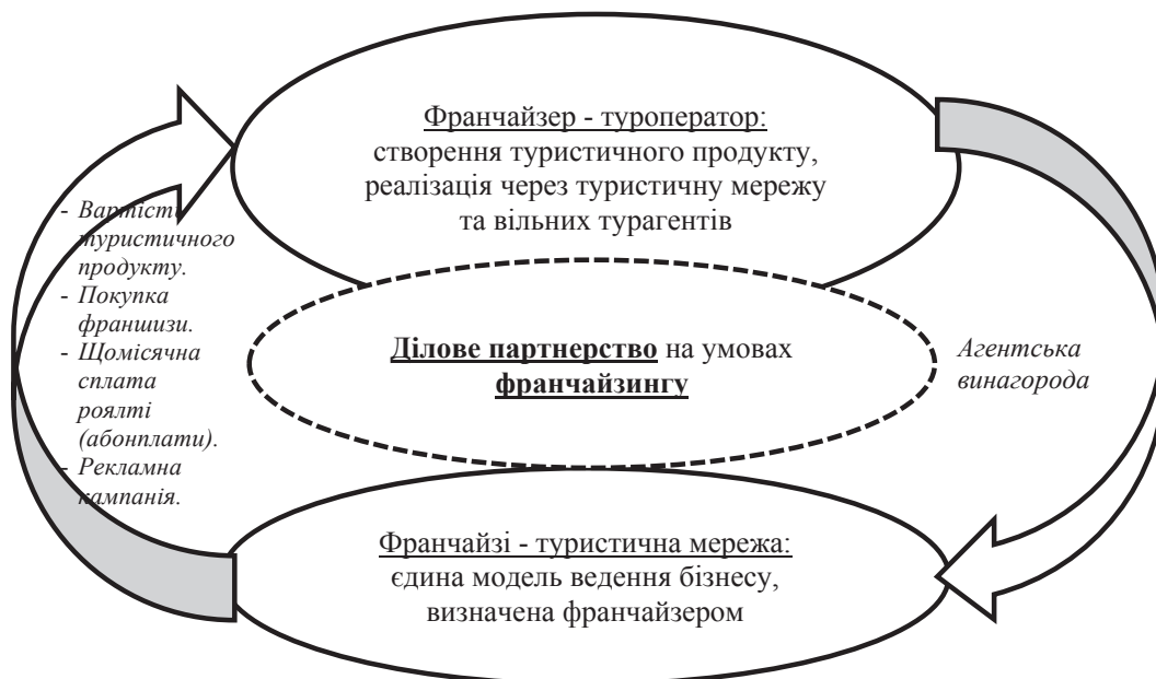
Рис. 2. Взаємозв'язок туроператора та турагента на умовах франчайзингу