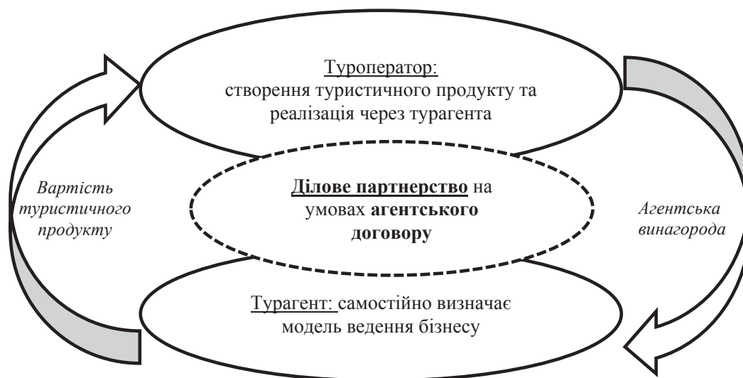
Рис. 1. Взаємозв'язок туроператора та турагента

За умов франчайзингової моделі туристичної мережі, коли франчайзером є туристичний оператор, а туристична мережа утворюється навколо домінуючої компанії та орієнтована на надання споживачам туристичних послуг лише даної компанії, взаємозв'язок туроператора та турагента має певні відмінності (рис. 2).