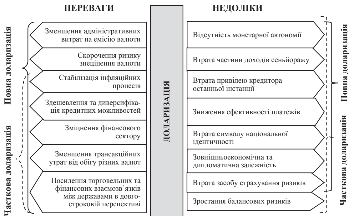
Рис. 2. Переваги та недоліки доларизації для країн, що розвиваються

2. Мінімізація ризику знецінення національної валюти та стабілізація інфляційних процесів (особливо в умовах офіційної доларизації чи різних