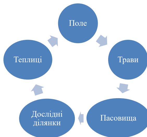
Рис. 2. Схема використання сільськогосподарського угіддя

Основними елементами системи управління витратами є об'єкти управління витратами (рівень, формування і структура витрат), технологія управління витратами (здійснення процедур, необхідних для