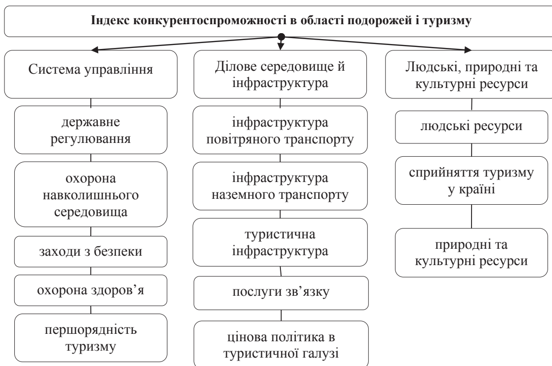
Рис. 1. Структура індексу конкурентоспроможності в області подорожей і туризму [7, с. 7]

Впровадження політики, спрямованої на покращання рівня розвитку екотуризму, передбачає існування певного плану дій, послідовності заходів. Для вирішення цього питання доцільно використовувати програмно-цільовий метод, який передбачає фор-