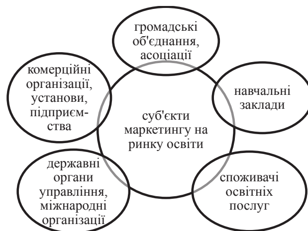
Рис. 1 Суб'єкти маркетингу на ринку освіти

З позицій маркетингу на освітянському ринку належне місце займають навчальні заклади, що ефективно використовують інноваційні методи навчання, сучасний інструментарій менеджменту, збалансовано формують портфель «попит – пропозиція», активно запроваджують співвідношення «ціна – якість», своєчасно проводять гнучку комунікаційну політику у напрямках реклами і зв'язку з громадськістю (рис. 1).