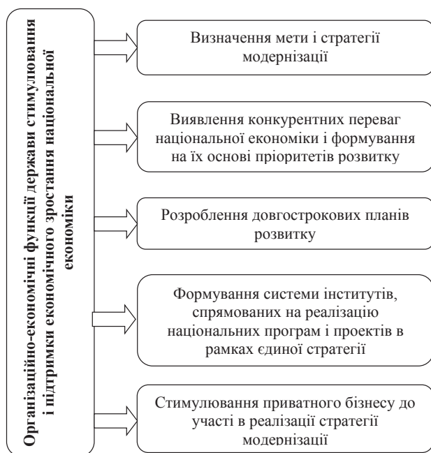
Рис. 3. Організаційно-економічні функції держави стимулювання і підтримки економічного зростання національної економіки

Формування державної інвестиційної політики – це складний процес, що базується на покроковості з урахуванням наукового підходу та прогнозування