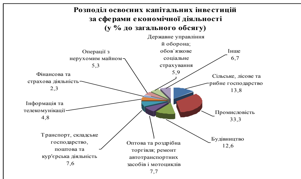
Рис. 1. Розподіл освоєних капітальних інвестицій за сферами економічної діяльності у 2016 р.

Аналіз динаміки освоєння капітальних інвестицій дає підстави стверджувати, що за загаль-