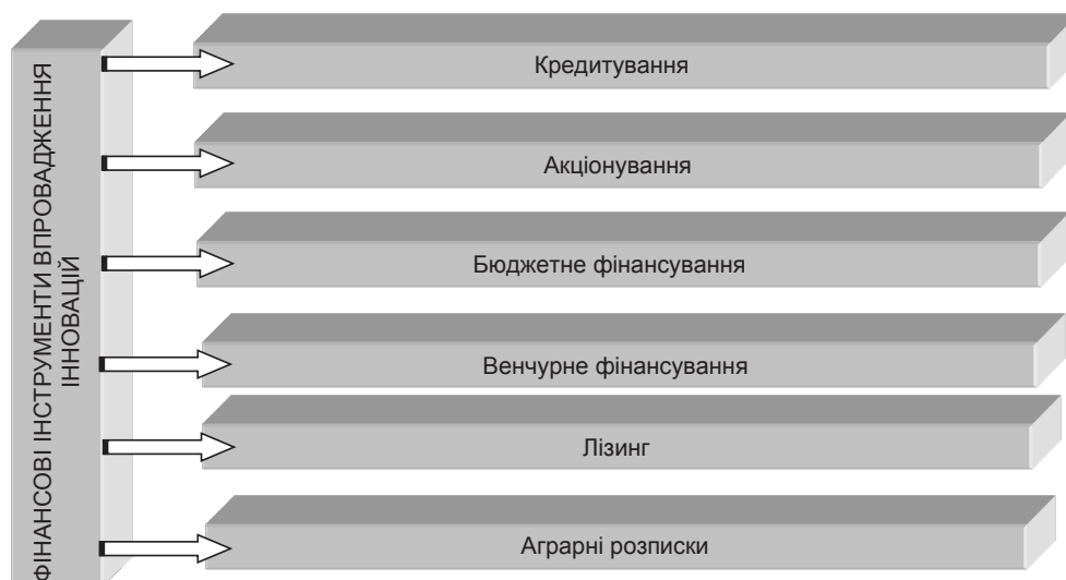
Рис. 1. Фінансові інструменти впровадження інновацій

Актуальними для акціонерних підприємств залишаються акціонування та форми часткового фінансування, які реалізуються за рахунок залучення коштів інвесторів та/або засновників підприємства для здійснення інвестиційного проекту, проведення додаткової емісії цінних паперів. Застосування методу залучення коштів акціонерів (учасників товариства) обґрунтовується тим, що витрати на проведення емісії можуть бути компенсовані у разі залучення значних обсягів фінансових ресурсів. До переваг акціонування та часткового фінансування можна віднести таке [7]: метод дає змогу залучити значні суми і необмежений у часі; виплати за користування залученими ресурсами здійснюються залежно від фінансового результату і не мають безумовного характеру; додаткова емісія цінних паперів дає змогу забезпечити формування достатніх обсягів ресурсів на самому початку реалізації проекту і забезпечує відстрочку виплат по них до настання періоду реалізації інвестиційного проекту й отримання підприємством доходів; можливість