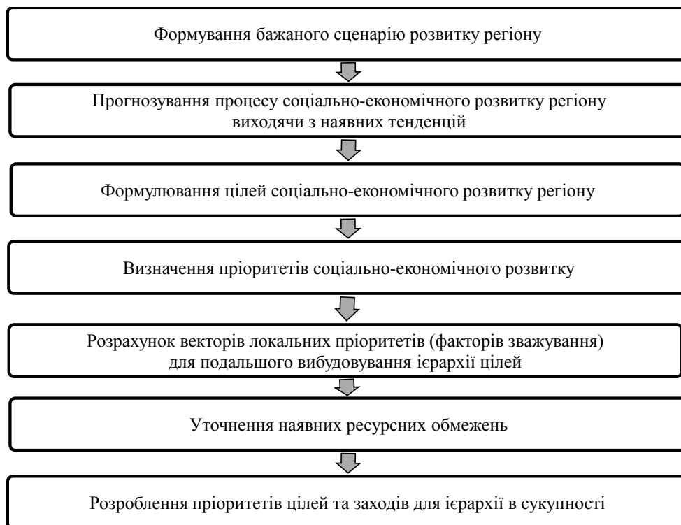
Рис. 2. Процес застосування АНР-методу для побудови ієрархії цілей управління збалансованим розвитком регіону

Основною проблемою цілепокладання в процесі управління збалансованим розвитком регіону є багатоцільовий характер прийнятих стратегічних рішень. Із цієї причини вважаємо необхідним використання в практиці управління регіональною економікою моде-